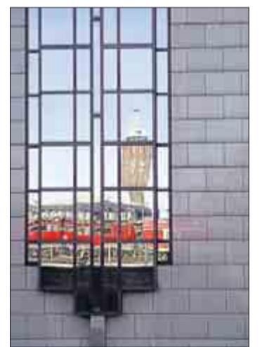
„Messeturm“ von Elke Boll.