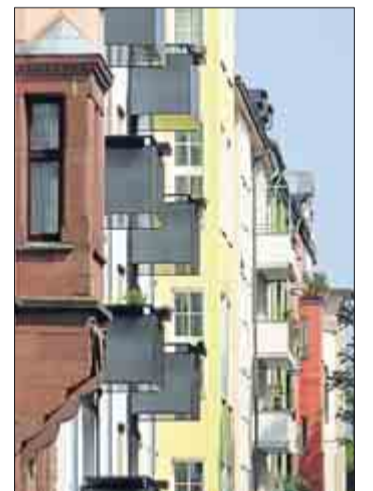
„Südstadt II“ von Helga Etterich.