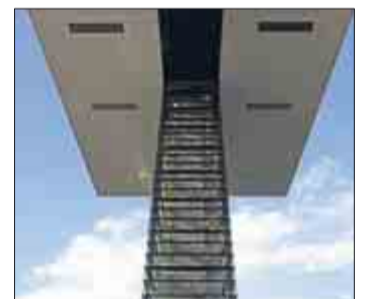
„Kran(treppen)haus“ von Heribert Stahl.