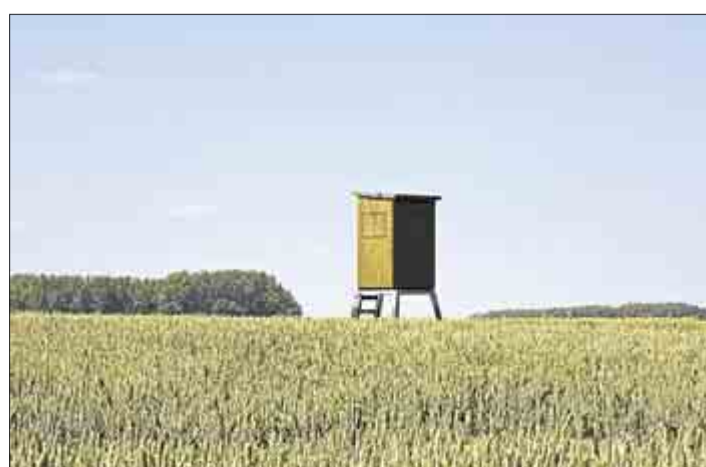
„Am Rande von Worringen“ von Brigitte Hilbrecht.