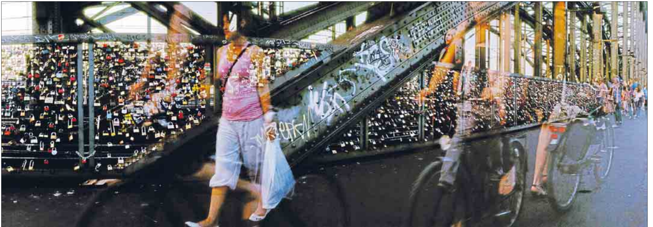
„Liebesschlösser“ von Thomas Dahmen.