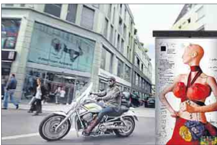
„Helden der Ehrenstraße“ von Martina Born.