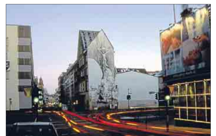
Aus der Reihe „17 Uhr 30“ von Roman Etmanski.